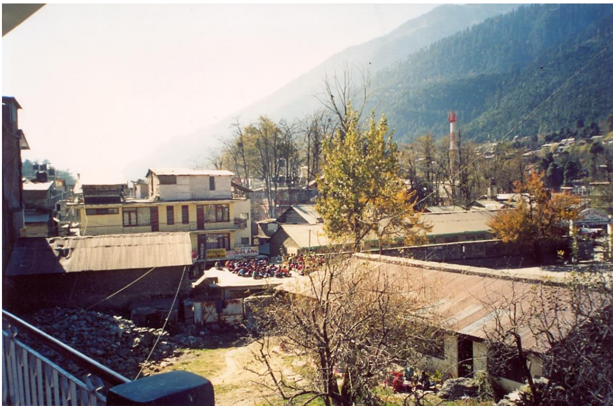
Вид из отеля

Спали до 13 часов в шапках, свитерах, шерстяных носках и под одеялами. Из отеля видны снежные вершины Гималаев и площадка перед школой, на которой дети сидят прямо на земле и учатся.